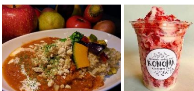
▲出店メニュー一例