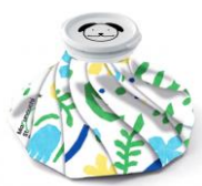
▲オリジナル氷のう