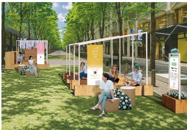
▲Block2（丸の内仲通りビル・丸の内二丁目ビル前）展開イメージ・昼

11社の共創企業と連携し、涼しさを五感で体感できるエリアを設置します。 芝生は遮熱・断熱技術を採用した人工芝を使用することにより、通常の人工芝と比較して、表面温度を約10℃抑え、夏場でも快適な空間を提供します。