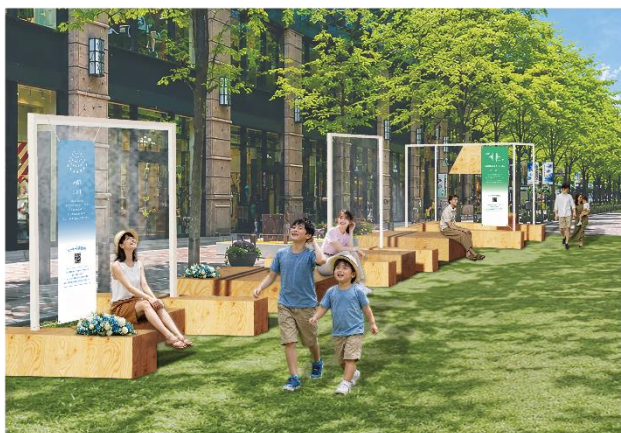
▲Block3（明治安田生命ビル・三菱一号館美術館・丸の内パークビル前）展開イメージ・昼