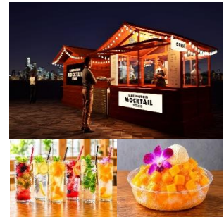
▲(上)Marunouchi Mocktail Stand (下)提供メニュー※一例