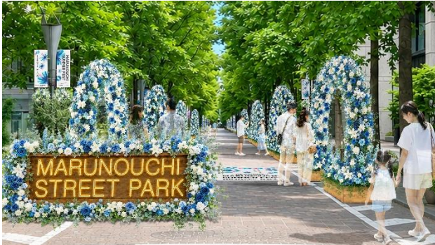
▲Block1（三菱商事ビル・郵船ビル・丸ビル前）展開イメージ・昼