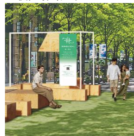
▲音・香りエリアイメージ