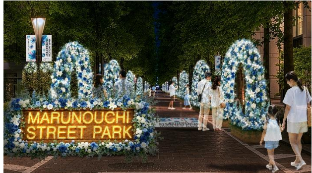
▲Block1（三菱商事ビル・郵船ビル・丸ビル前）展開イメージ・夜