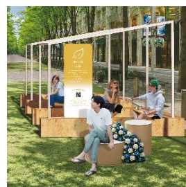
▲日陰エリアイメージ