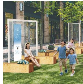
▲風エリアイメージ