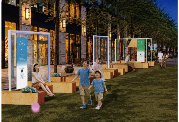
▲Block3 (明治安田生命ビル・三菱一号館美術館・丸の内パークビル前) 展開イメージ・夜