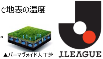
▲パーマヴォイド人工芝 J.LEAGUE