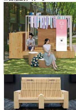
▲（上）風エリアイメージ （下）空調機能付きベンチ