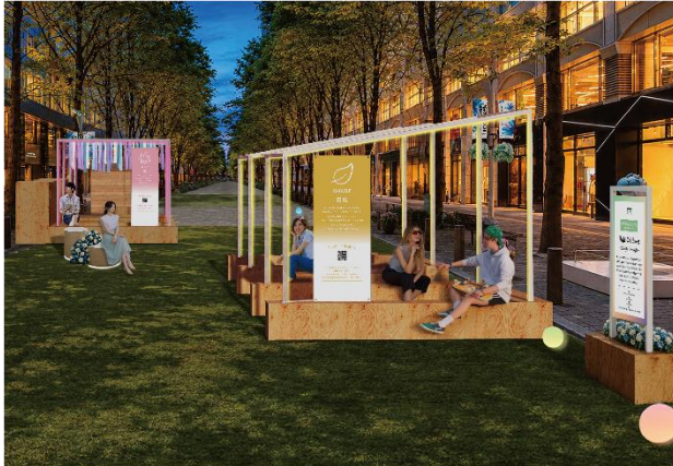
▲Block2 (丸の内仲通りビル・丸の内二丁目ビル前) 展開イメージ・夜

各什器をネオンで彩り、丸の内仲通りを就業者や来街者が集い、飲食や会話を楽しめる「夜の遊び場」へと変化します。光る遊具の貸出や飲食スペースの設置により昼とは異なる滞在価値を提供し、終業後や飲み会前にも気軽に立ち寄れるナイトタイム空間を創出します。さらに、音楽とともにくつろげる空間に加え、ヨガやカラダづくりなど酷暑対策のプログラムも展開し、ネオン演出とともに丸の内の夏の夜を五感で楽しめます。